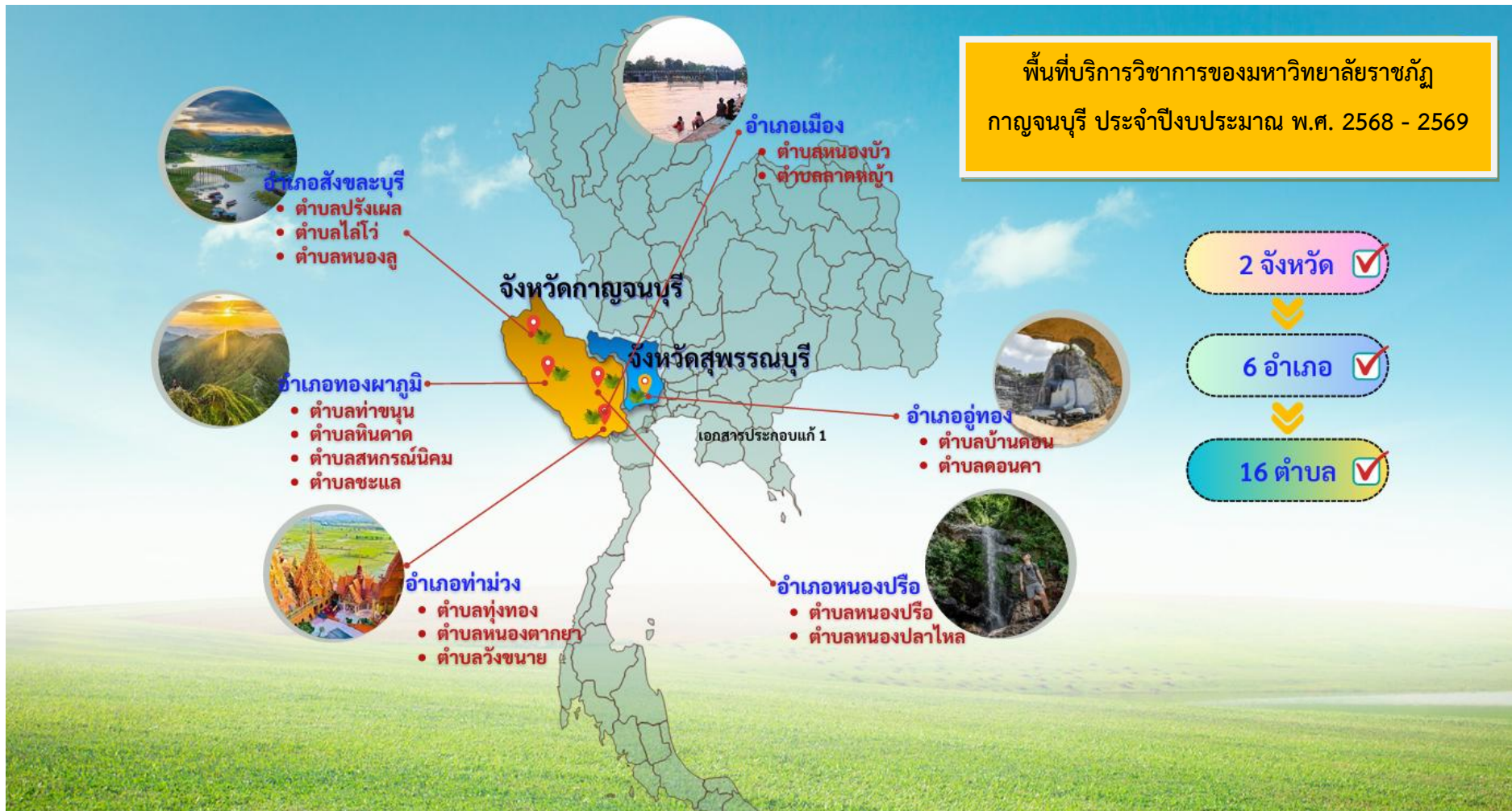
ภาพที่ 1 แสดงพื้นที่บริการวิชาการของมหาวิทยาลัยราชภัฏกาญจนบุรี ประจำปีงบประมาณ พ.ศ. 2569

ซึ่งจากการทบทวนแผนบริการวิชาการ มหาวิทยาลัยราชภัฏกาญจนบุรี ระยะ 5 ปี พ.ศ. 2566 – 2570 (ฉบับทบทวนประจำปีงบประมาณ พ.ศ. 2569) มหาวิทยาลัย มีพื้นที่รับผิดชอบทั้งหมด 2 จังหวัด 6 อำเภอ 16 ตำบล แสดงดังแผนภาพ ดังนี้